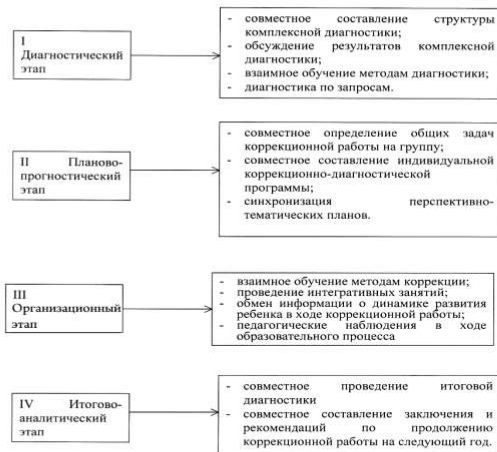
Рисунок 3. Система взаимодействия специалистов в процессе диагностики.

Данные комплексной диагностики каждого воспитанника заносятся в «Карту психолого-педагогического и медико-социального развития ребенка», в которой проектируется разработка Индивидуального коррекционного маршрута развития , в котором систематизируются все наблюдения и рекомендации специалистов, динамика развития ребенка.