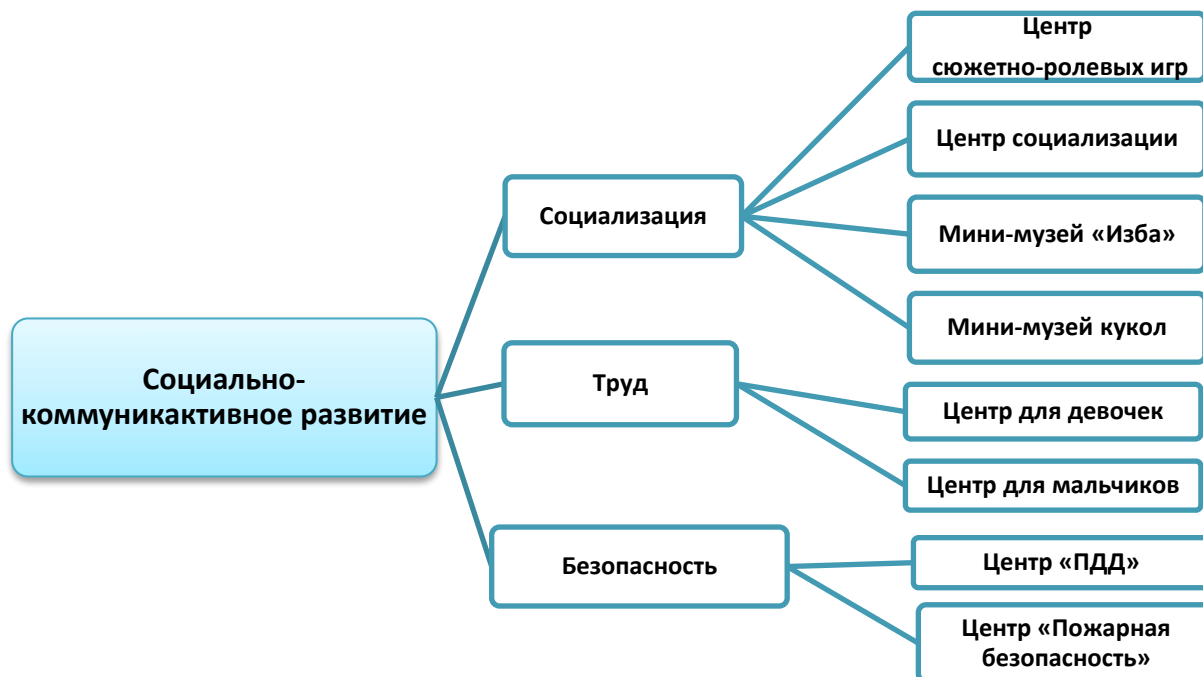
Рисунок 2. Структурная модель предметно-пространственной среды группы.

Центры детской активности обеспечивают все виды детской деятельности, в которых организуется образовательная деятельность.