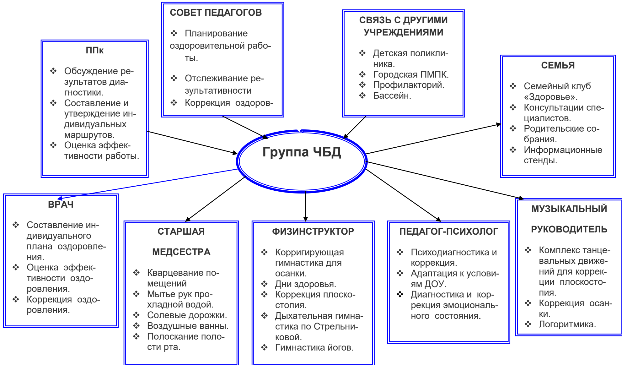
Рисунок 1. Схема организации деятельности с часто болеющими детьми в МБ ДОУ №121